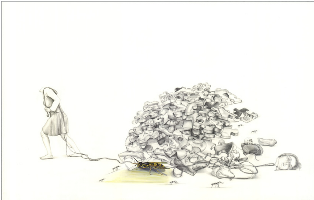
Μολύβι και τέμπερα σε χαρτί, 102X66cm, 2012