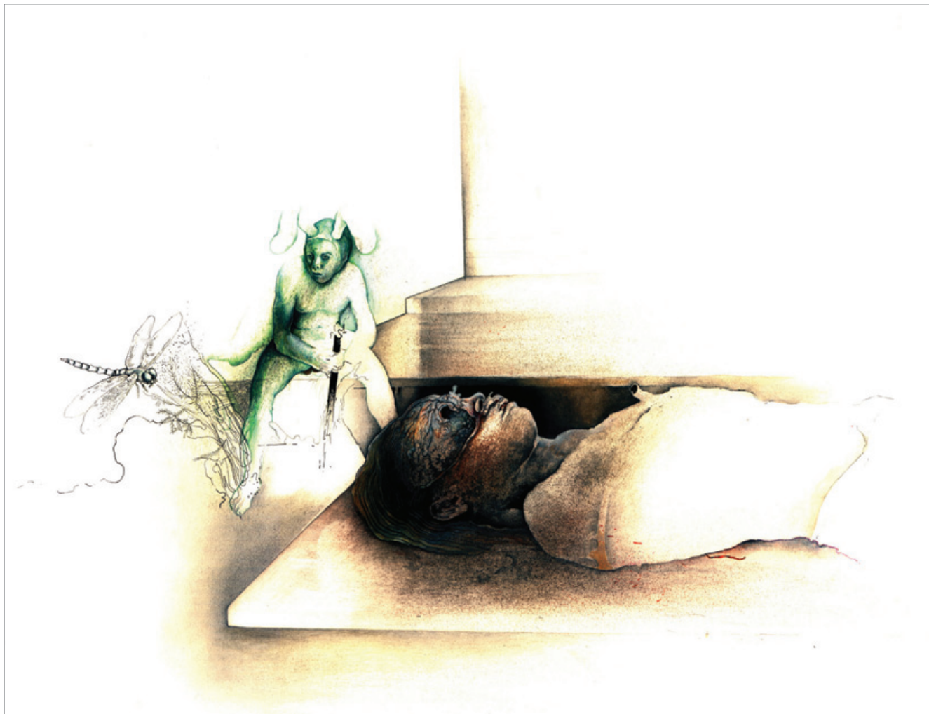
Γραφίτης, χρωματιστά μολύβια, ακουαρέλα και λάδι σε χαρτί, 66X51cm, 2012